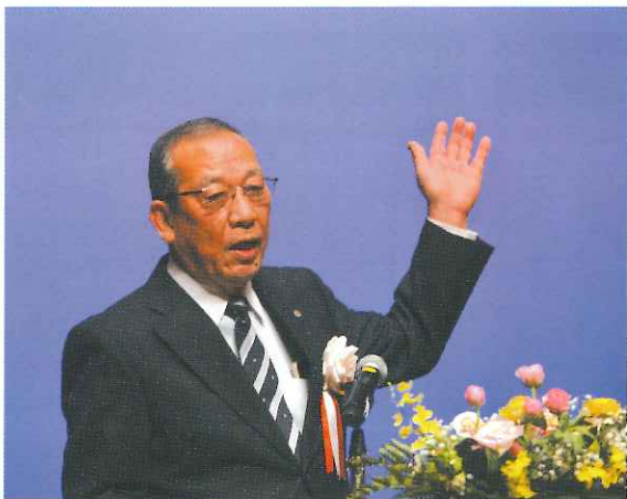
亀阜地区社会福祉協議会会長