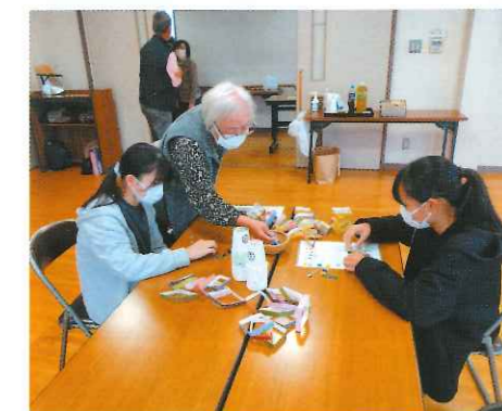
子どもたちとの交流