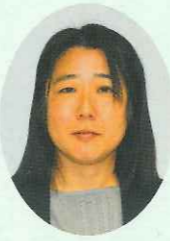
香川県教育委員会他 スクールソーシャルワーカー