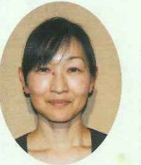
高松市立宮脇保育所所長