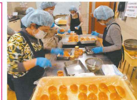
ロールパンサンド作り