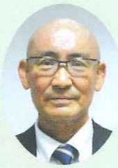
高松市民児連主任児童委員部長