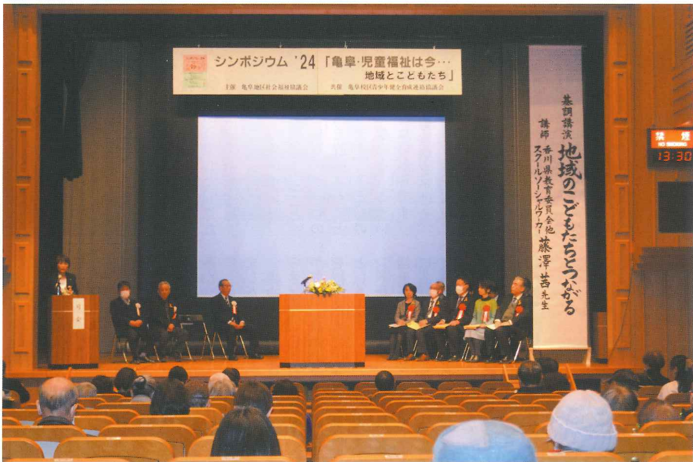
シンポジウム'24開催(令和6年2月4日)