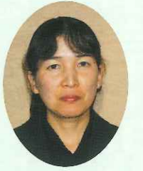
亀卓校区子ども会 育成連絡協議会会長